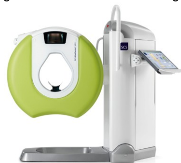
Digitale Volumetomografie – 3 D Röntgen

In unserer Praxis haben wir ein neues diagnostisches Verfahren eingeführt, die sogenannte DVT (dreidimensionale Röntgenuntersuchung). Dieses Verfahren ist strahlensparend und ermöglicht eine exakte 3D-Röntgendiagnostik im Bereich des Skeletts, insbesondere im Bereich der Füße, Hände, Knie, Ellenbogen und HWS. Hierdurch kann auch nach frischen Verletzungen eine noch exaktere Abklärung der knöchernen Verletzung, z.B. auch mittels Röntgen unter Gewichtsbelastung, durchgeführt werden. Die Strahlendichte ist geringer als bei einer konventionellen CT-Untersuchung. Die Kostenübernahme seitens der privaten Versicherungen und der Berufsgenossenschaften besteht. Bei den gesetzlichen Krankenkassen muss im Vorfeld eine Genehmigung zur Kostenübernahme erfolgen.